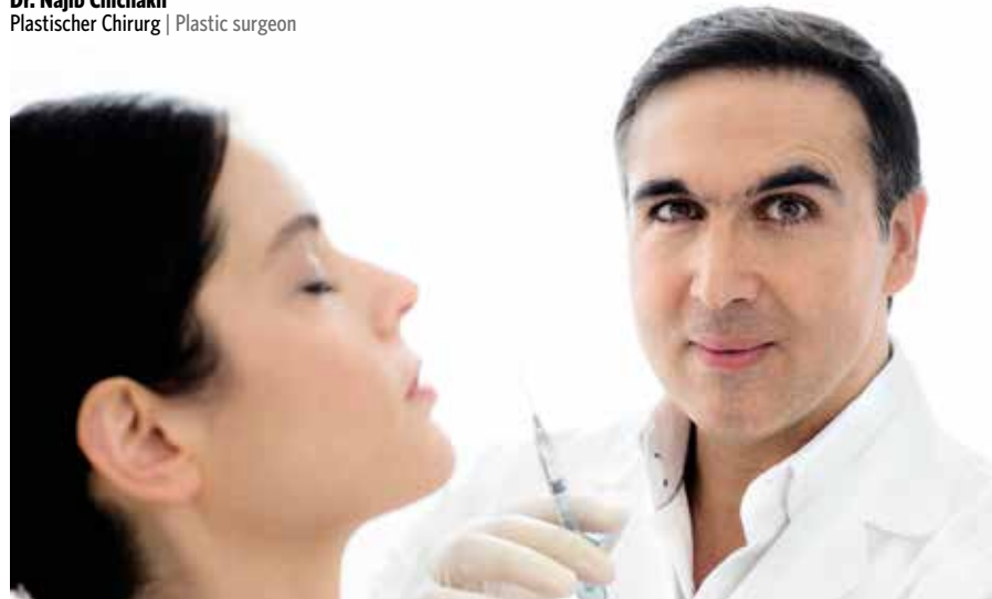
Dr. Najib Chichakli Plastischer Chirurg | Plastic surgeon

ternal circumstances, including working from home, widespread lockdowns and mask-wearing mandates. The fact that we're all much less present at work and make fewer appearances in the public sphere, which makes much more time available for rest and relaxation, is a strong argument in favour of opting for treatment right now.