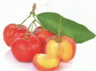
Vitamin C Acerola-Beeren