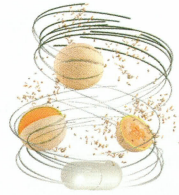
GliSODin Das antioxidative Enzym