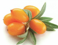
Sanddornberöl Omega 7