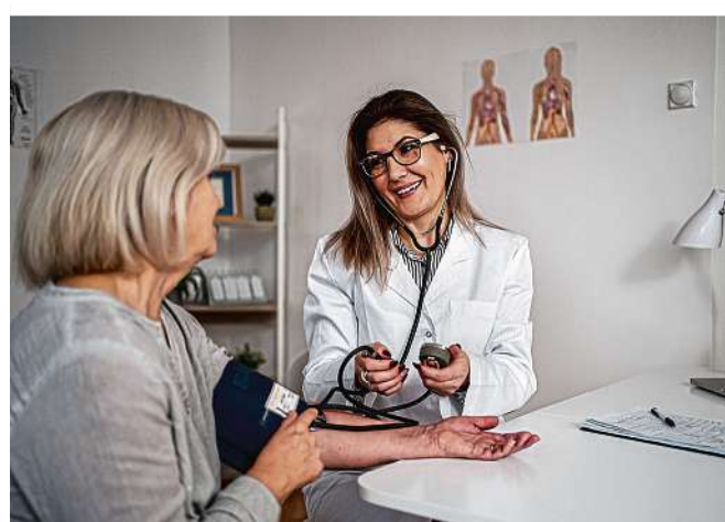
Vertrauen ist beim Arztbesuch eines der wichtigsten Dinge

Für die Studie „Österreich beliebteste Ärzte“ wurden eine Million Bewertungen und Kommentare von Patienten im Internet herangezogen. Dazu wurden rund eine Million Bewertungen zu rund 20.500 niedergelassenen Ärztinnen und Ärzten aus vielfältigen Onlinequellen und Plattformen herangezogen. Alle gesammelten Texte wurden durch eine automatisierte Analyse bestimmten Kategorien wie Einfühlungsvermögen, Beratung und Service zugewiesen. Dann wurden die Kategorien gewichtet und auf dieser Basis Punkte vergeben. Die Auszeichnung erhalten jene Ärzte, die in ihren Fachbereichen jeweils die Top-Bewertung vorzuweisen haben. Heute lesen Sie die ausgezeichneten Ärzte aus den Bereichen Anästhesie, Augen, Chirurgie, Frauenheilkunde, Orthopädie, Unfallchirurgie und Physikalische Medizin sowie Allgemeinmedizin. Weitere Kategorien lesen Sie am 11. 5. und am 12. 5.